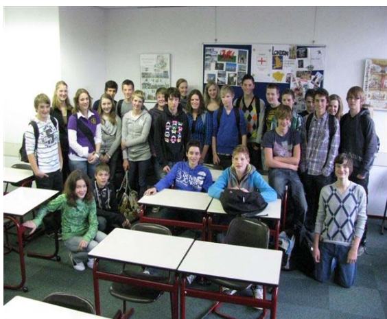
Leerlingpanel Atheneum onderbouw

In deze uitgave vindt u onder andere informatie over de ouderklankbordgroep, het leerlingpanel en een aantal belangrijke data in de maanden januari, februari en maart.